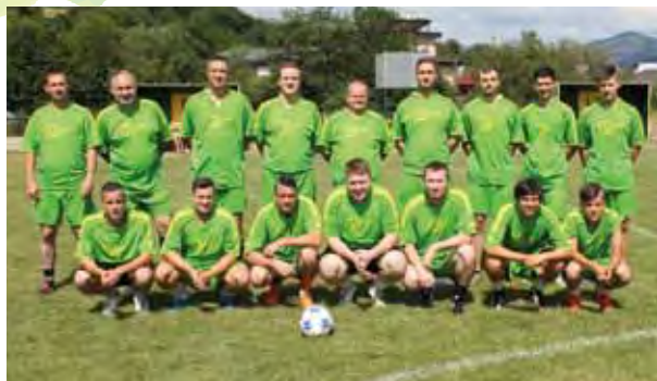
4. miesto – Dúbravka