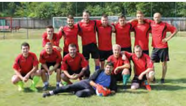
1. miesto – Štepnica