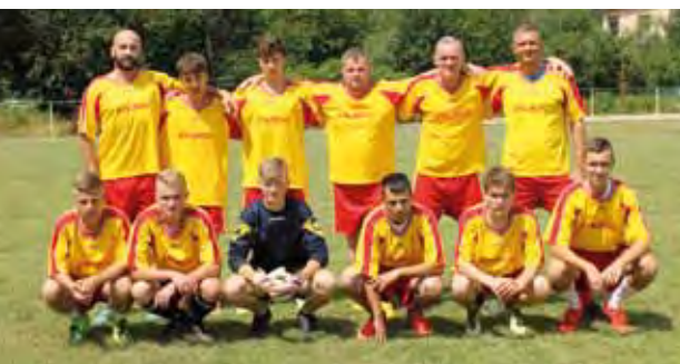
2. miesto – Kaštieľ