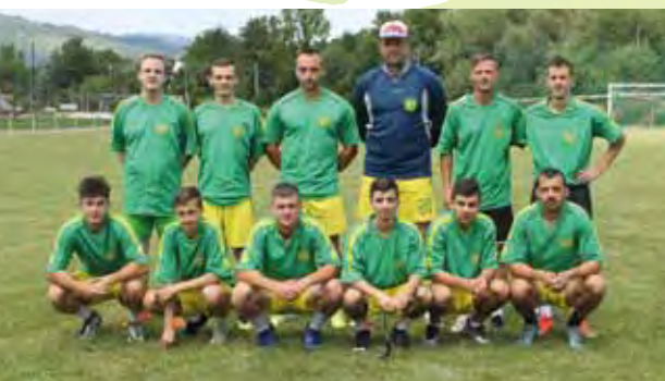
3. miesto – Lány