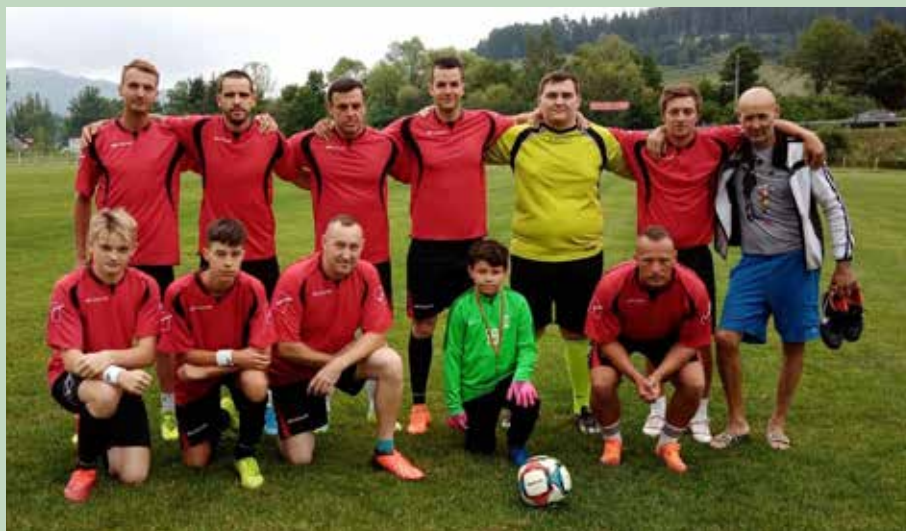
1. miesto 2022 - Štepnica