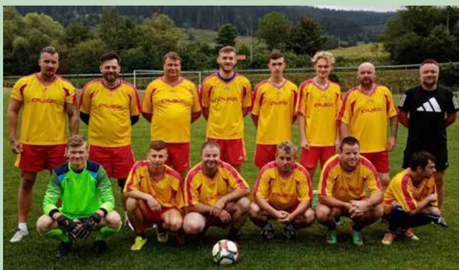
3. miesto - Kaštieľ