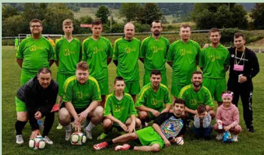
2. miesto 2022 - Lány